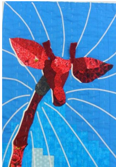
Quilt met quiltdlijnen met EZ tape

U heeft nu een blauwe lap van ongeveer 55 cm x 70 cm.